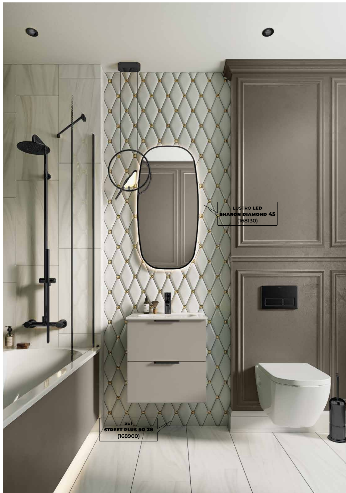
LUSTRO LED SHARON DIAMOND 45 (168130)