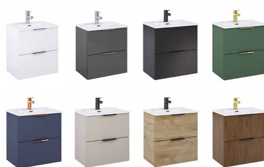
SET 50 2S

FRONT I KORPUS: PŁYTA LAMINOWANA / LAKIEROWANA 16 MM ZAWIASY: SYSTEM SOFT-CLOSE SZUFLADY: PEŁEN WYSUW UCHWYTY: WYKONANE Z METALU